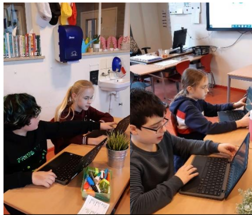
Samen bedenken hoe je achter een betekenis kunt komen van een moeilijk woord