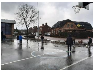
In de pauze samen een spel spelen