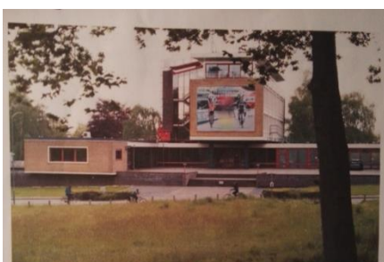
De plek van het toekomstige kindercentrum.

U kunt te allen tijde ook terecht bij de medezeggenschapsraad van onze school. Zij zijn uw vertegenwoordigers.