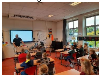
Ouders vertellen over hun beroep