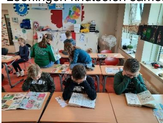
Het leesalarm is gegaan...