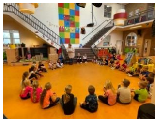
De leerlingen luisteren...