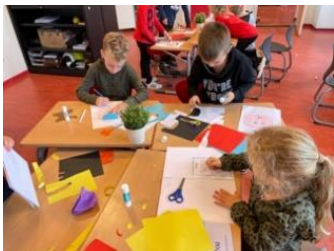
Leerlingen knutselen samen

Wij kijken terug op een leuke en leerzame periode, waarbij het stimuleren en het motiveren van de jeugd voor het lezen, centraal heeft gestaan.