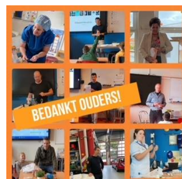
Enkele ouders die iets vertellen over hun beroep