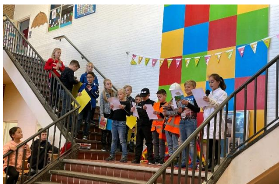
Afsluiting Kinderboekenweek 2021

Blijf altijd geloven in hetgeen je graag wil!