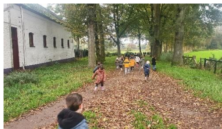
Lekker op weg naar het bos..