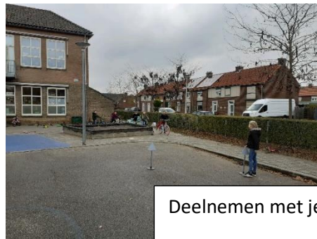
Deelnemen met je fiets aan het verkeer Groep 3-4 is tevens naar de firma Nijland Tweewielers B.V. geweest voor een rondleiding. De kinderen weten nu alles over de fiets.