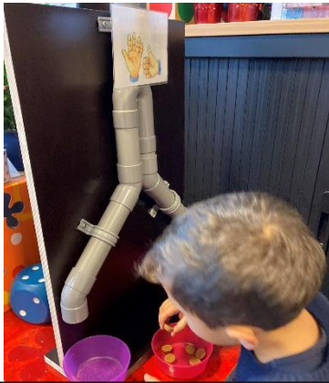
Zes pepernoten in een splitsmachine