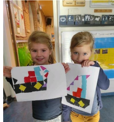
Zelf een boot geknutseld