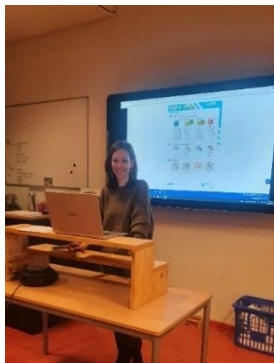
Thuisonderwijs in groep 4