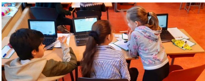
Waarom moeilijk doen als het samen kan!