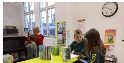
Opdrachten rondom het boek 'Katvis'